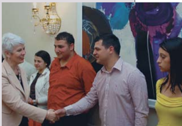
Jadranka Kosor sa studentima romske nacionalnosti

I u Karlovcu je bilo svečano u povodu svjetskog dana Roma. Tamo je Centar kulture Roma uručio karlovačkom gradonačelniku Damiru Jeliću Povelju zahvalnosti za dobru suradnju i pomoć romskoj manjini u Karlovcu. Povelju je uručio predsjednik Foruma Roma Hrvatske i zagrebačke Stranke Roma Kasum Cana . Cana je rekao da Karlovac ima razumijevanja za probleme Roma i da su vidljivi pomoci u uređenju naselja na Orlovcu, na Kamenskome i u Skakavcu.