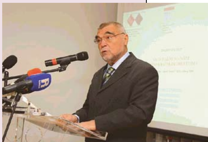
Predsjednik Stipe Mesić govori na znanstvenom skupu "Nacionalne manjine u demokratskim društvima" u svibnju u Begovom Razdolju

Intervju s pučkim pravobraniteljem Juricom Malčićem u povodu prve godišnjice primjene Zakona o suzbijanju diskriminacije