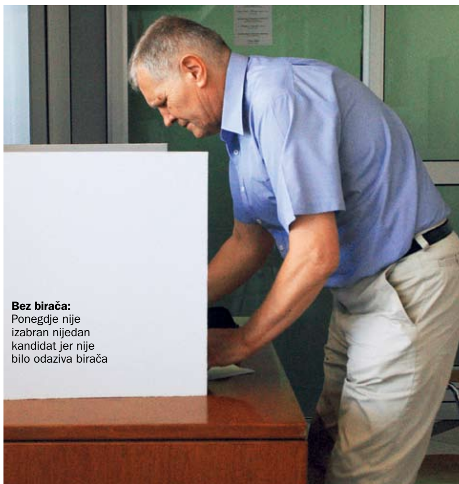
Bez birača: Ponegdje nije izabran nijedan kandidat jer nije bilo odaziva birača

rati članove vijeća nacionalnih manjina (tamo gdje su bili predloženi kandidati) na razini županije imalo je ukupno 348.450 birača, na razini grada ukupno 166.789 birača i na razini općina 91.745 birača. No na izborima je na razini županije, što je čini se i odredilo ukupan rezultat, glasovalo 10,44 posto birača (33.365 birača), na razini grada 9,45 posto (15.760 birača) i na razini općine 15,93 posto (14.617 birača). K tome, za listu predstavnika manjina pravo birati na razini županije imalo je 13.870 birača, na razini grada 8840 birača i na