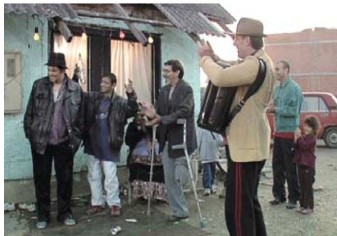
Jezič Film je snimljen na jeziku romske nacionalne manjine

Kratki hrvatski igrani film "Recikliranje" redatelja Branka Ištvančića uvršten je u selekciju petoga međunarodnog filmskog festivala "Kratkofil Plus", održanog u Banjoj Luci od 9. do 13. kolovoza. Radnja filma prati romsku obitelj s ruba velegrada koja na gradskom deponiju skuplja odjeću. "Recikliranje" je dio omnibusa "Zagrebačke priče" snimljen u produkciji zagrebačkog Propeler filma na jeziku romske nacionalne manjine u Hrvatskoj, a dio uloga dobili su Romi naturšćici. U filmu glume Slaven Knezović, Ana Maras, Asim Ugljen i drugi.