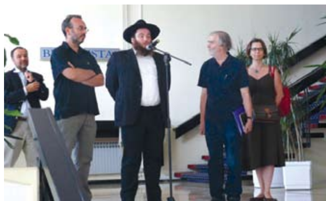
Identitet Jačanje židovskoga kulturnog identiteta kroz pjesmu i motiviranje članova židovskih zajednica za rad u kulturi i umjetnosti